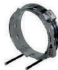
ARO DE GORRA

IMAGENES ILUSTRATIVAS CONSULTA TÉRMINOS Y CONDICIONES