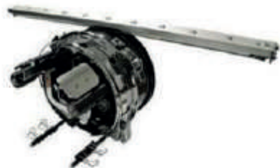
DISPOSITIVO DE GORRA

Los anillos de gorra se colocan en el embastador y dan el soporte necesario para que la gorra no se mueva durante el proceso de bordado.