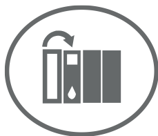
Sistema de suministro de tinta ininterrumpido