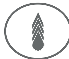
Sistema de tinta a granel Mimaki