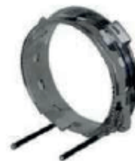
ARO DE GORRA

IMAGENES ILUSTRATIVAS CONSULTA TÉRMINOS Y CONDICIONES