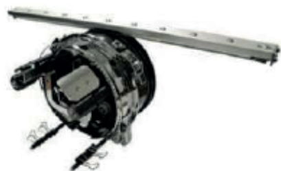
DISPOSITIVO DE GORRA

Los anillos de gorra se colocan en el embastador y dan el soporte necesario para que la gorra no se mueva durante el proceso de bordado.