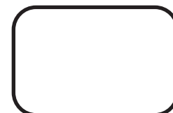
Bastidor rectangular universal 180 cm x 40 cm

Ahora podrás realizar trabajos de mayor tamaño, ya que la bordadora ETM1504 incluye un bastidor de 180cm x 40cm.