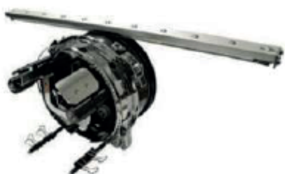
DISPOSITIVO DE GORRA

Los aros de gorra se colocan en el embastador y dan el soporte necesario para que la gorra no se mueva durante el proceso de bordado.