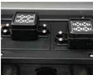
Sistema de plataforma, sistema de limpieza y protección de la boquilla.