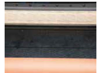
Plataforma de grado industrial, planitud de 0-0.5mm para asegurar una superficie de impresión.

Imágenes ilustrativa Consulta Términos y condiciones