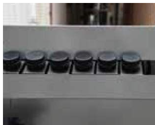
Suministro con alta eficiencia UV, sistema de endurecimiento con patrones delicados y gran adhesión.